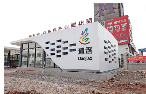
■出入口设置了人行梯道和无障碍通道