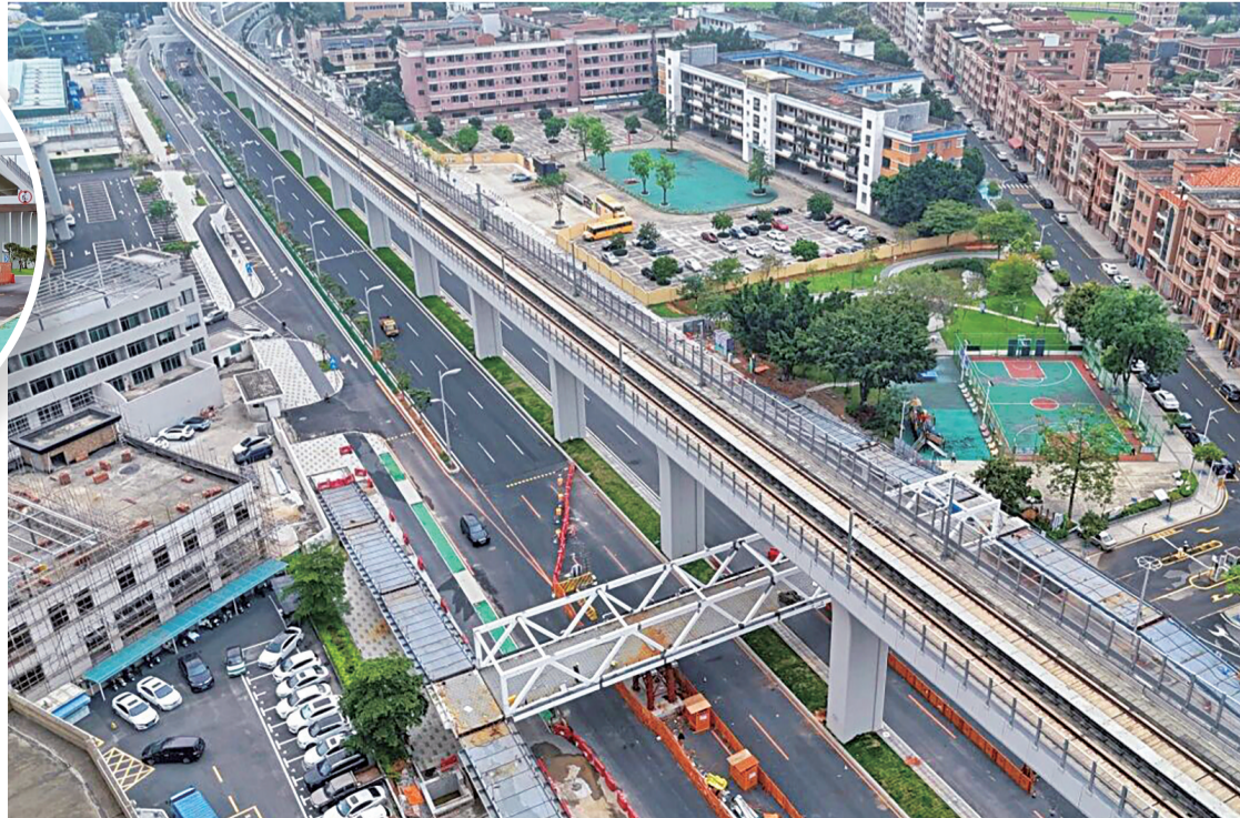
■这座横跨西部干道的人行天桥，连接新城小学、大岭丫村和大新鸿基小区

距离天桥开通还有最后两个月，周边居民纷纷表示期待。这座“高颜值”且功能齐全的人行天桥，将为道滘增添一道安全与便利并重的城市新景。