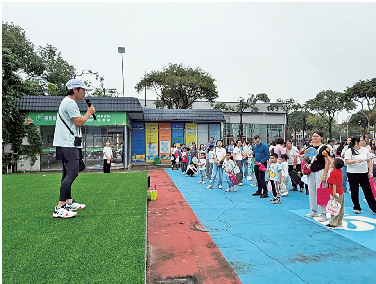
■5月10日上午，道滘镇在大岭丫村海川营地匹克球场开展亲子匹克球派对活动