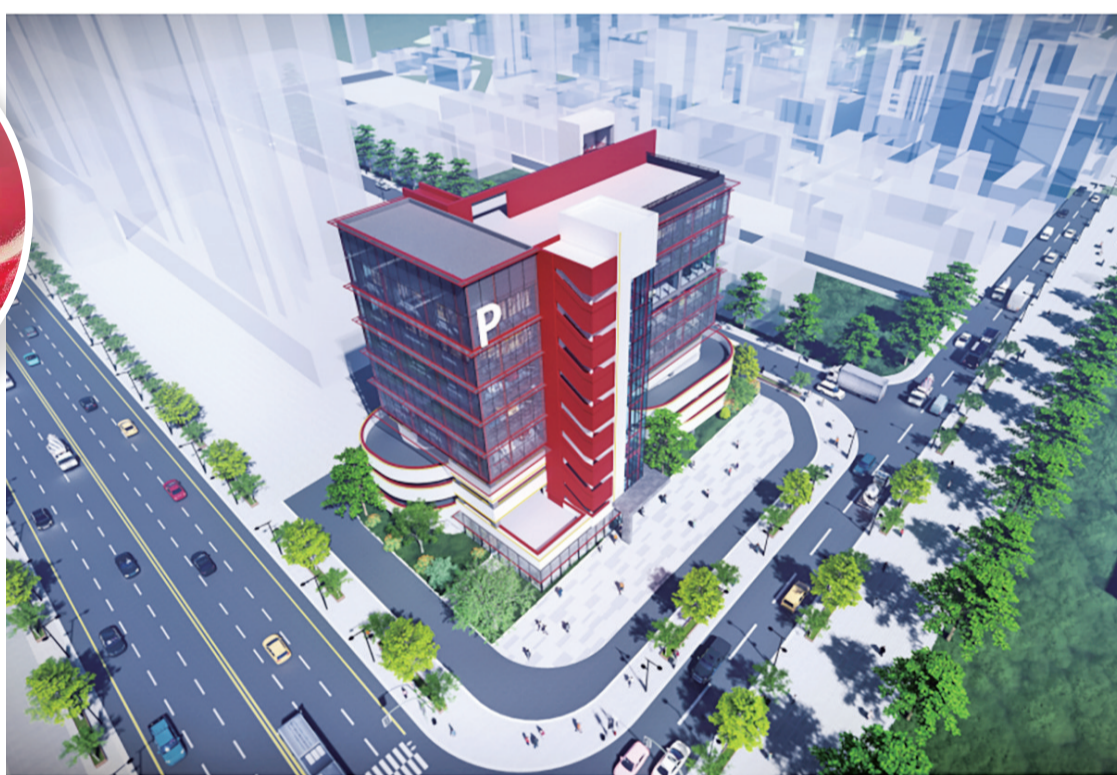
■大岭丫村马嘶塘立体停车场项目效果图

随着马嘶塘立体停车场的投用，大岭丫村停车环境与村容村貌将显著提升。道滘镇将以此为契机，持续深化交通综合治理，务实推动“百千万工程”落地见效，为群众营造更加便捷、有序的出行环境。