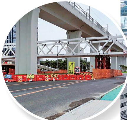
■道滘大岭丫人行天桥

据介绍，天桥建成后将显著改善周边交通环境。新城小学家长接送孩子无需再穿行西部干道，大岭丫村村民前往对面小区、市场或