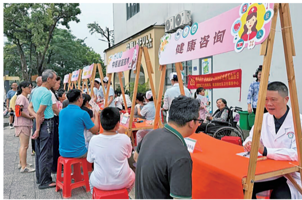
■中医义诊便民服务区提供一站式公益健康服务

下一步，道滘镇将持续聚焦家庭建设、民生健康、人才发展，常态化开展各类惠民文体公益活动，不断丰富群众精神文化生活，夯实家庭幸福基石，助力辖区社会文明和谐高质量发展。