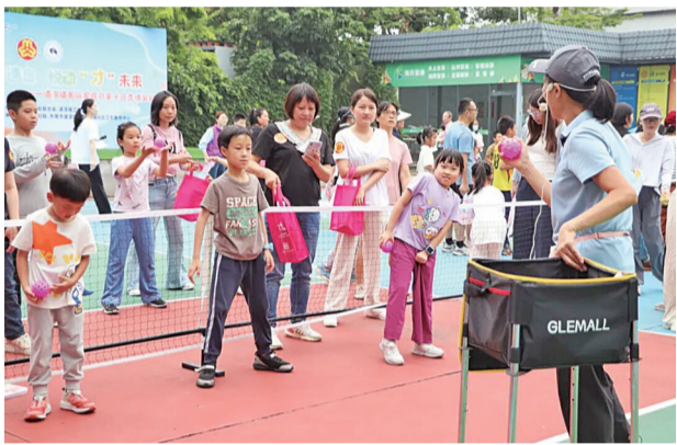
■专业教练进行趣味十足的匹克球体验教学