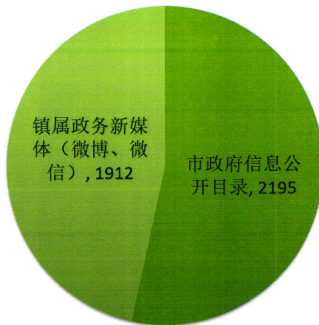
图1：各类政务动态信息4107条

在东莞市政府信息公开目录系统公布政府信息数 2195 条（组织机构 32 条、政策文件 14 条、财政信息 111 条、业务工作 772 条、通知公告 147 条、工作动态 841 条、关注茶山 278 条、其他信息 27 条），通过镇属政务新媒体（微博、微信）公开政府信息数 1912 条。此外，还刊发电视新闻 925 条，短视频 350 条，编印《茶园报》23 期。