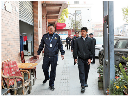
■1月29日上午，道滘镇组织开展全域文明建设专项行动

接下来道滘将持续加大日常巡查频次，健全常态化监管机制，强化部门协同与宣传引导，推动全域文明建设走深走实，不断提升城市环境品质和居民生活幸福度。