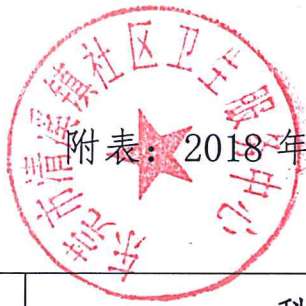
附表：2018年部门决算支出总表